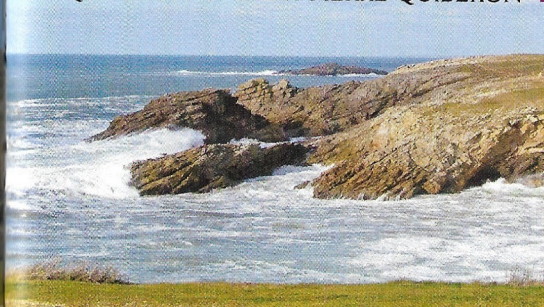
Quiberon, port Pilote. -DM-

Venez découvrir les anciens villages de pêcheurs nichés sur les rochers escarpés de la Côte Sauvage. À mi-chemin en passant au pied de la tour d'un ancien sémaphore, ne manquez pas la vue panoramique sur la presqu'île et les îles environnantes.