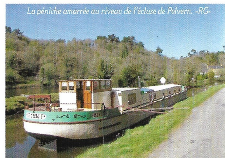
La péniche amarrée au niveau de l'écluse de Polvern.

Les remparts offrent une bonne idée de la riche histoire d'Hennebont. Construits au XIII e siècle, sur ordre du duc de Bretagne Jean I er Le Roux, ils ont payé un lourd tribut lors des différents conflits, la dernière fois lors de la Seconde Guerre mondiale, avant d'être à chaque fois restaurés.