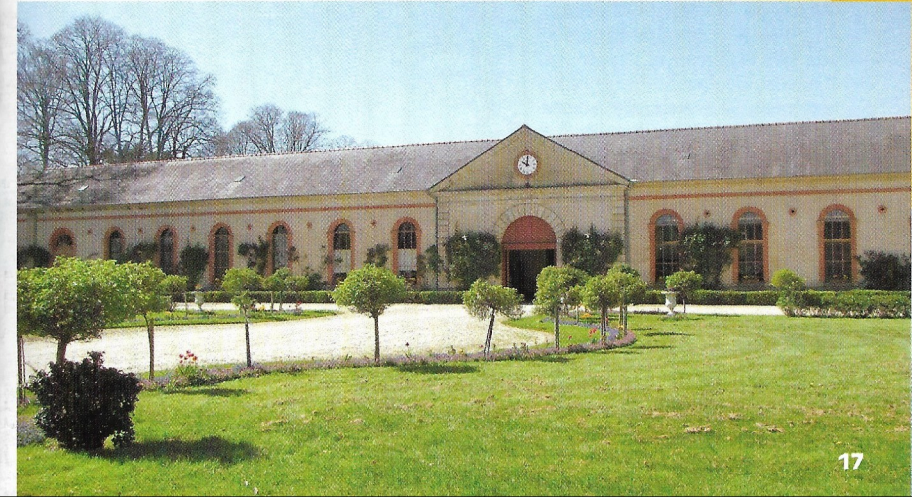
L'entrée des haras nationaux. -RG-

Balilage : aucun de D à 4, 5 à D ; blanc-rouge de 4 à 5