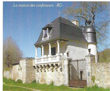
La maison des confesseurs. -RG-